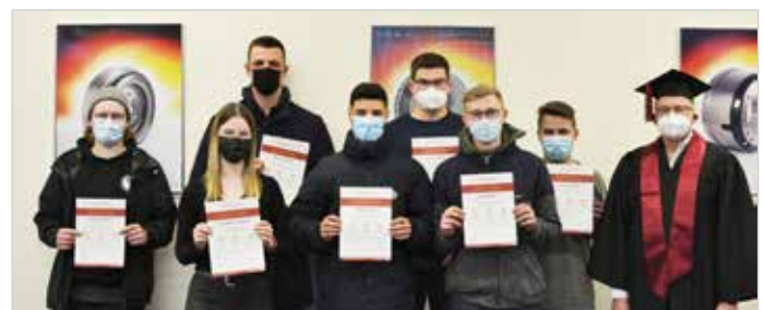
▲ Lohn des Lernens: Anfang Januar 2022 nahmen die erfolgreichen Teilnehmenden der Finanz-Schulung ihre Zertifikate entgegen

Sie ergänzt: „Die JAV möchte dem gesamten Firmen-Nachwuchs die Chance geben, das finanzielle Wissen zu erweitern. Deshalb streben wir an, dass zumindest alle drei Jahre bei Busch eine Geldlehrer-Fortbildung stattfindet.“