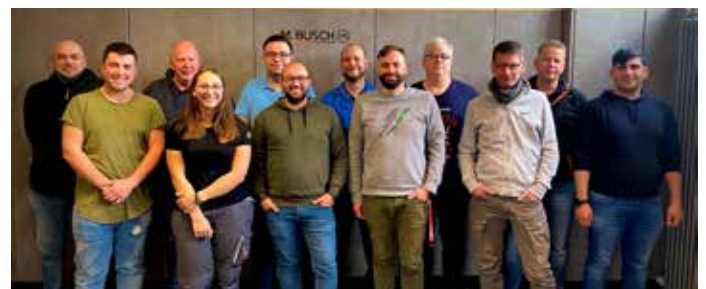
▲ Alle neugewählten Betriebsratsmitglieder nahmen die Wahl an

Eine Rückschau auf die Arbeit des Busch-Betriebsrates in den vergangenen vier Jahren, die auch durch die Corona-Pandemie sehr herausfordernd für alle waren: Der Betriebsrat konnte vieles bewegen. So wurden im Jahr 2018 Mitarbeiter in beiden Werken aus der Befristung vor-